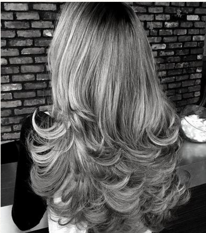
PONTAS VIRADAS PARA FORA