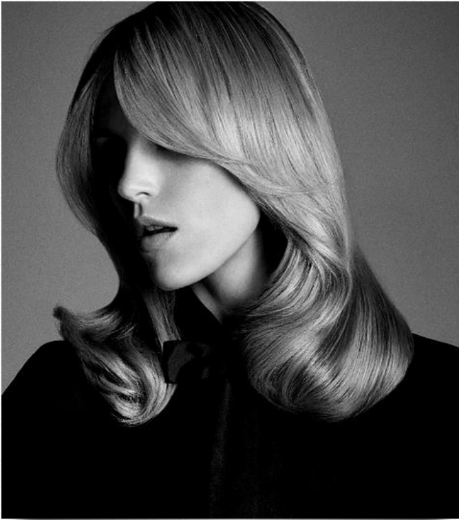
PONTAS VIRADAS PARA DENTRO