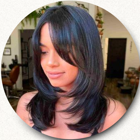
pontas viradas para dentro