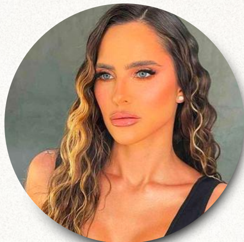
ondulado com aspecto natural