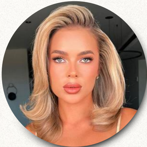
raiz com volume