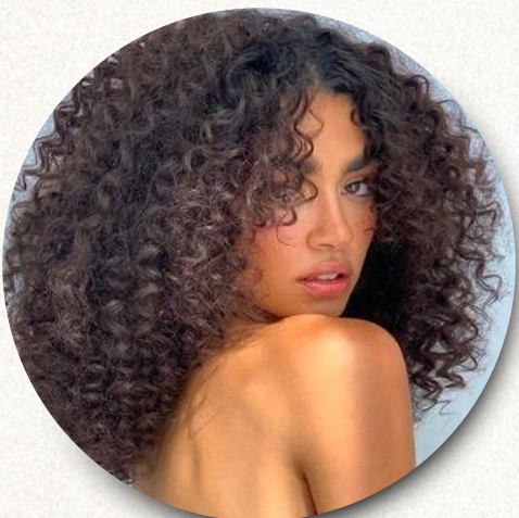
definição de cachos