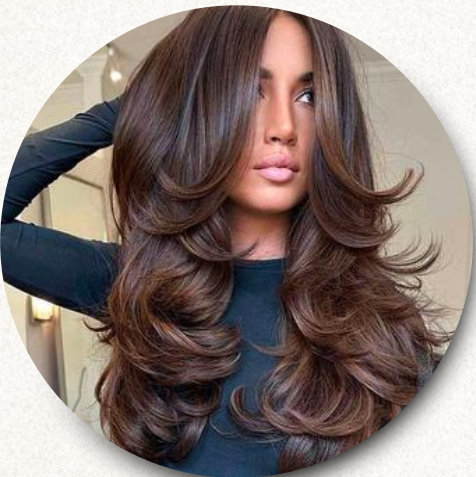
pontas viradas para fora